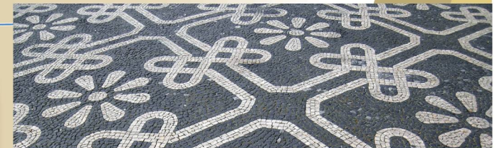
Tapeçaria urbana: calcário e basalto na calçada portuguesa