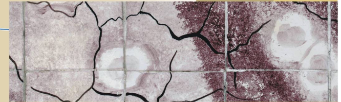
Ajulezos de rudistas: Paleontologia e artes decorativas